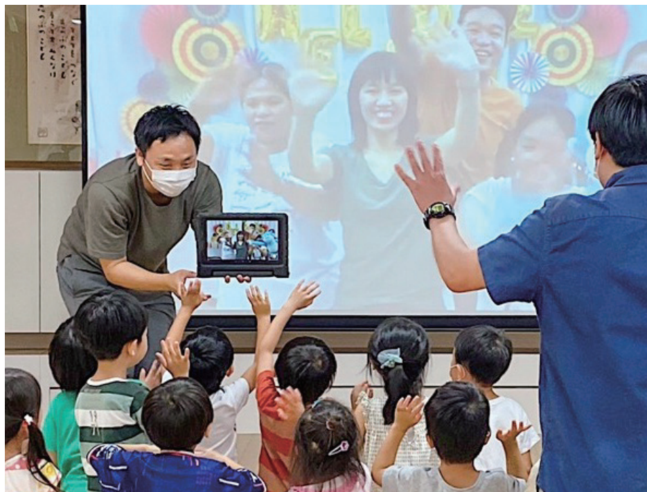
使用するツールはオンライン会議ツール「Zoom」。現地にファシリテーター兼通訳がいるため、保育者が英語を学ぶ必要はなし。スクリーンやプロジェクターはレンタル可能。

在園児の約15%が海外にルーツを持つ。多文化共生に積極的に取り組み、2021年に創立110周年を迎える。