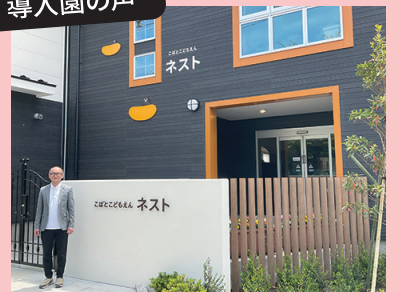
学校法人柏こぼと学園（千葉県柏市） 今春開園のこぼとこどもえんネストでは、 子どもの主体性を大事にした教育・保育 のための活動や空間づくりに取り組む。