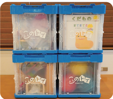
遊び心をくすぐるコンテナ梱包

企業主導型保育園このはな保育園を運営するオフィス桐生(三重県鈴鹿市)は、2021年10月、月齢に合わせたおもちゃを届ける子育てサブスク「このトイ」を家庭向けにリリースしました。 おもちゃは保育園監修のもと、「0〜6か月」「6〜8か月」「8〜10か月」「10〜12か月」に分類され、ハイを促進するおもちゃや手先を自然と使うおもちゃなど、子どもの成長をサポートするのに最適なおもちゃを厳選しています。