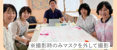
社会福祉法人聖光会（東京都） 「アタタカイヤトリ」を合言葉に園児1人ひとりを大切にする保育を実践。都内に4園のグループ園があり、全体研修等で理念を共有するなど一体感の高さが魅力。

2021年7月、都内で4園を経営する聖光会は理念や保育方針の言語化を目的に、チームビルディングス(株)が提供するブランドビルディング会議に取り組みはじめました。