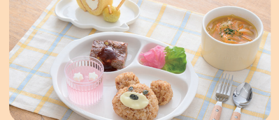
株式会社ウエルビーフードシステム(静岡県清水区) 食べる「力」は、生きる「力」。医療・介護食、配食サービス、社員食堂などを通じて美味しく・楽しく・栄養豊かな食事を提供。

美味しく食べてもらうか? 園の先生の声をもとに、調理の仕方や味付けを調整して献立を考えます。菜園活動で採れた野菜を献立に反映できることも自園給食のよさ。野菜嫌いでも自分で育てたものが給食になると口にできたという経験は、食育の成功例の一つです。最近は給食室の中が見える園も増える中、園内調理により食への興味を掻き立て、健康な体と心を育む効果も期待できます。