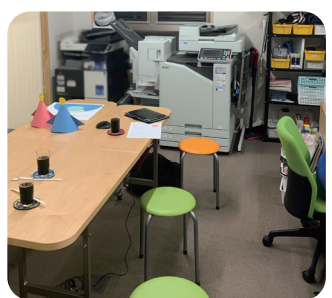
オフセットステープル排紙トレイを付けてもすっきり収まる

また、枚数が多い資料のホチキス止めも、オフショのオフセットステープル排紙トレイを接続すると全自動に。大量プリントにかかる時間は5分の1にまで短縮でき、「急に何部かほしいときにもすぐ用意できる」と、忙しい職員の強い味方になっています。同トレイはコンパクトサイズで、場所を取らないことも大きな特長です。