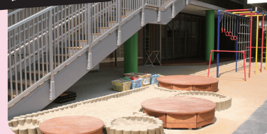
スカウトランドひまわり幼稚園（広島県呉市）

「元気・勇気・笑顔」がモットー。野外での直接体験・自然体験活動を中心に、のびのびした保育を展開している。