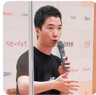
oVice 代表取締役CEO・ジョン氏