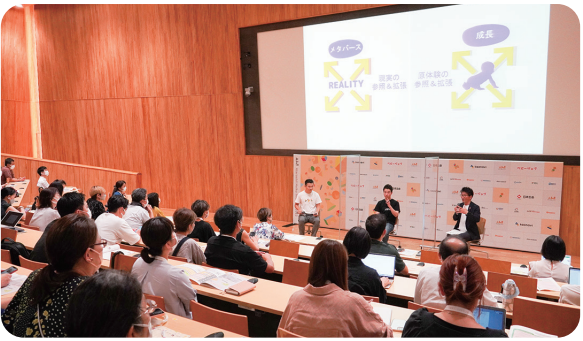
セッション「メタバース時代における保育のあり方」の様子

話題の最先端テクノロジー「メタバース(仮想空間)」と、直接的・具体的な経験が大切にされる保育を