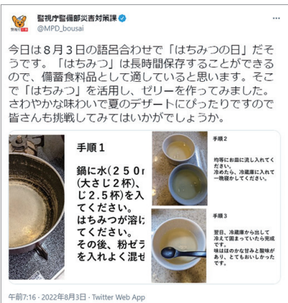
警視庁警備部災害対策課ツイッター (@MPD_bousai)

地震や豪雨など、有事を想定した警備計画の策定や、実際に災害が起きたときに機動隊を派遣して救助活動を行う警視庁警備部災害対策課。地域防災の一環として