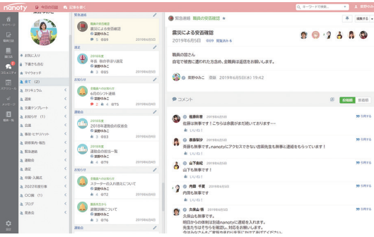
nanotyの掲示板画面。安否確認の投稿にコメントし、職員の被災状況を確認

「nanoty」は、園日誌や会議の議事録、スケジュールなどを職員間で共有できるSNS型の情報共有サービスです。2017年のリリース以来、日頃の情報共有に活用されてきましたが、災害時にも活用されるケースがあるとのこと。 災害時は、職員も被災者。園に来られない職員がいたり、長時間にわたって電話が使えなかったりと、職員連携も難しいものです。そうしたとき、nanotyの掲示板に職員の安否確認や園の被害状況を投稿すれば、