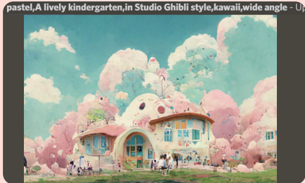
④ 「U1」～「U4」を押すと、細部まで描き込まれた絵が1枚完成

現在、25件まで無料で画像生成可能。非商用であれば無料プランでも自由に公開できますが、商用利用する場合は有料プランに加入する必要があります。