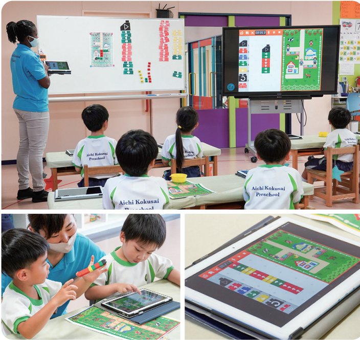
(上)自分たちの考えたプログラムで目的地にたどり着けるかをモニターで確認 / (下)リアルなブロックが子どもたちの興味関心や想像力を高める

授業では、先生が進む方向や進むマス数、ブロックの色を子どもたちに問いかけながら、ホワイトボードにマグネットブロック(※園で制作)を貼り付けていきます。その後、先生が