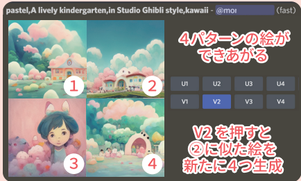
③ できた絵に対し「V1」～「V4」を押すと、似たデザインの絵が新たに4つ生成