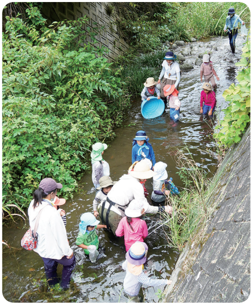
「苔は滑りやすいから気をつけてね!」。サポート会員と職員が見守る中、1時間半たっぷり里山あそび。この日は、川に棲む小さなお魚に遭遇!

幼少期における自然体験の場をいかにつくるか。発達段階に合わせた環境教育を行う認定NPO法人しずおか環境教育研究会(エコエデュ)を訪ね、年中・年長児対象のプログラムに密着。フィールドは自然豊かな里山です。