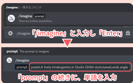
② メッセージ欄に、「/imagine」と描いてほしい絵のイメージができる言葉を入力

Midjourneyのよさは、生成した画像に対し「もっと細かく」「似たデザインで」という指示ができること。一度で思い通りの絵ができなくても、4つの中から好きな絵を選び、似たデザインを繰り返すことで、自分のイメージに近づくことができます。また、「in ukiyo-e style (浮世絵風)」「watercolor painting (水彩画)」のように、AIが理解しやすいキーワードを知っておくこともポイントです。