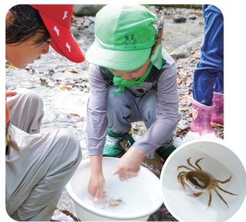
赤ちゃん抱えた親ガニに興味津々

「自然の中での教育を通じて失敗・変化の中から自分の答えを追求する人を育てる」をミッションに環境教育を行う。2013年に内閣総理大臣賞、2021年に環境大臣賞を受賞。