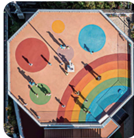
園のシンボルである虹の色調も実現

さくらんぼ幸田に隣接し、2021年3月に開園したでんでんむしハウス。子どもが子どもらしく生活できるように、わくわくドキドキするような保育に取り組んでいる。