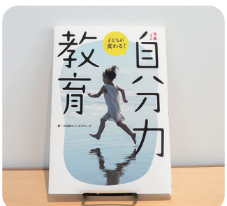
やる気メソッドの一端を紹介

「自分力」とは、50年以上にわたり数多くの子どもたちを指導してきた(株)やる気スイッチグループが提唱する「自分で考え、自分で決め、自分で行動する力」のこと。人生100年時代を迎え、生きる力の必要性に注目が集まる今、同社はこの「自分力」がこれからの時代を生き抜く指針となるといいます。しかし、自分力を発揮するには子どもたちの個性にあった教育や周囲のサポートが不可欠。加えて、経験則で学びが築かれる「9歳まで」という時期が大切なのだろう。本書では、自分力の土台を育むための具体的な方法が実例を交えて紹介されています。子どもの個性を見つけて、伸ばしたい全ての方にお届けしたい1冊です。