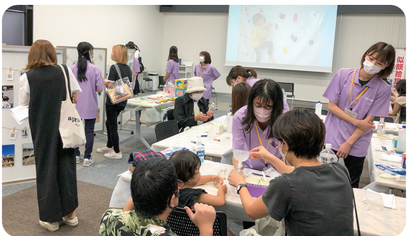
BiVi 藤枝内のイベント会場には、様々なコーナーが設けられ、実行委員会メンバーが笑顔で来場者を迎えた

藤枝市保育協会は、2022年9月10日、保育の仕事に興味がある人を対象に保育職場の楽しさを伝えるイベント「ほいくカフェ2022」をBiVi藤枝で開催しました。