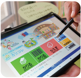
貸出履歴は園のみ閲覧可。気ままに利用できると好評

一歩足を踏み入れると、鮮やかな色ガラスと様々なジャンルの本の表紙が目飛び込んでくるカンガルー保育園の図書室。保育室から少し離れたところにつくられた図書室では、子どもや保護者が自由に出入りし、本を借りることができます。「一冊の本を読み終えていく過程で自己を照らし合わせたり、感情を起伏させたりすることで人間らしい成長を促す。本はそうした人の基礎をつくるもの」