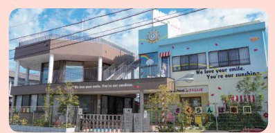
Kids school さくらんぼ幸田・でんでんむしハウス(愛知県)

さくらんぼ幸田に隣接し、2021年3月に開園したでんでんむしハウス。子どもが子どもらしく生活できるように、わくわくドキドキするような保育に取り組んでいる。