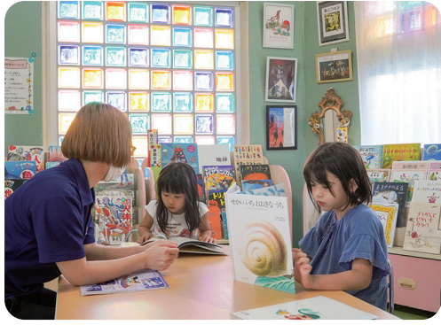
蔵書数は800冊超。保護フィルム貼付時に取り除いた表紙を壁面に飾るなど興味を引く工夫も

「日本語が美しい」「画や挿絵から想像力が育まれる」など、園長自らが仕入れた蔵書数が800冊を超えるカンガルー保育園。2021年4月、図書貸出システム「カリコレ」で図書貸出を開始。その想いを伺いました。