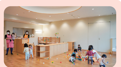
企業内保育所 Smile Kids(滋賀県) 2022年4月に開園。木を基調とした温かな空間に加え、おむつ替えスペースにある小窓から保育ルーム全体を見渡せる設計が特徴。