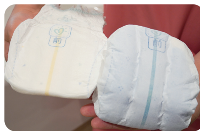
「パンパースは吸収力がすごいんです!」と向先生。コップ1杯分の水も漏れなく吸収

onth」のラインナップの一つ。導入園は保護者に加入を案内し、加入した保護者が同社と直接契約・月額利用料を支払うしくみ(保育料に含め、園からまとめて支払うことも可能)です。園には利用状況に応じてポイントが貯まり、園で使える物品やギフト券と交換できます。パンパースのおむつ・おしりふきに加え、「1Month」内で提供されている布団やおしぼりなど、登園に必要なセットを選べるメニューの豊富さもコラボならではの強みです。