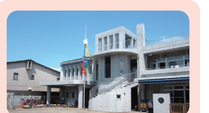
あいわ保育園(東京都)

健康で明るく、のびのび生活することを第一に、協調性や自分で考えて生きていく力を育むことを大切にしている。