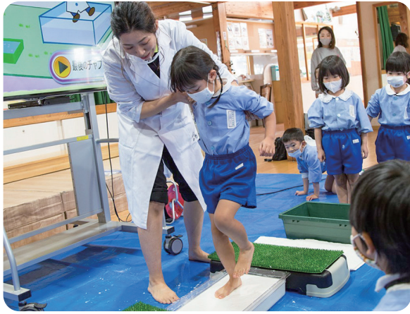
「どろりん」の不思議な感触に子どもたちも歓声を上げる

2022年、全国学力調査では4年ぶりに理科も実施されました。背景にあるのは、児童・生徒の「理科離れ」。そうした中、手軽に本格的な科学実験を行える「かがくあそびONLINE」が注目を集めています。