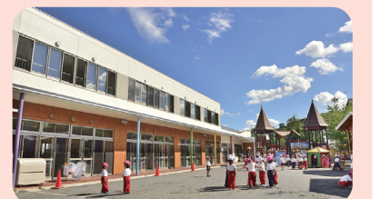
認定こども園 桂岡幼稚園(北海道)

健康で明るく、のびのび生活することを第一に、協調性や自分で考えて生きていく力を育むことを大切にしている。