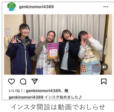
いいね！: genkinomori4389、他 genkinomori4389 インスタ始めました♪ インスタ開設は動画でお知らせ