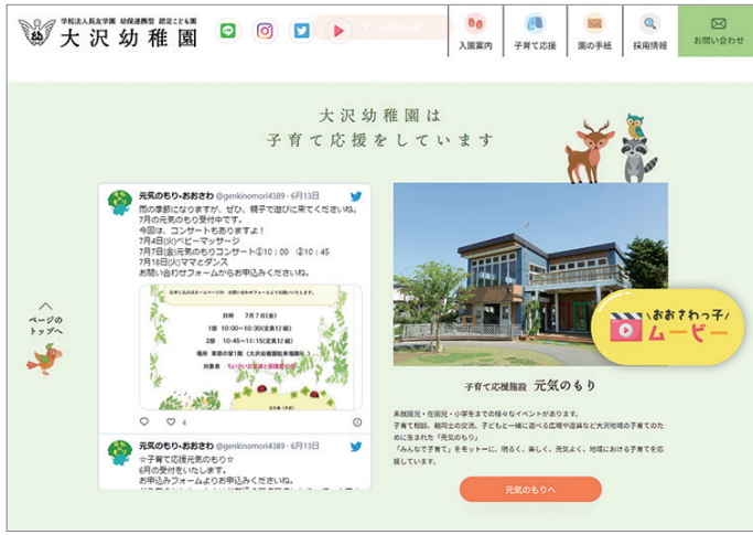
大沢幼稚園のホームページ。ページ上部にSNSのリンクを入れ、未就園児向けの子育て広場の紹介欄にTwitterを埋め込み表示している

園内の様子を手軽に伝えられるSNS。親しみを持ってもらいやすく、園児募集や採用にも効果的です。これまで複数のSNSで発信を行ってきた大沢幼稚園に活用方法や発信のコツを伺いました。