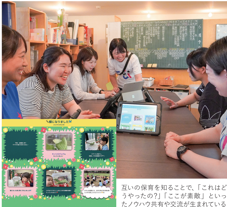
互いの保育を知ることで、「これはどうやったの?」「ここが素敵」といったノウハウ共有や交流が生まれている