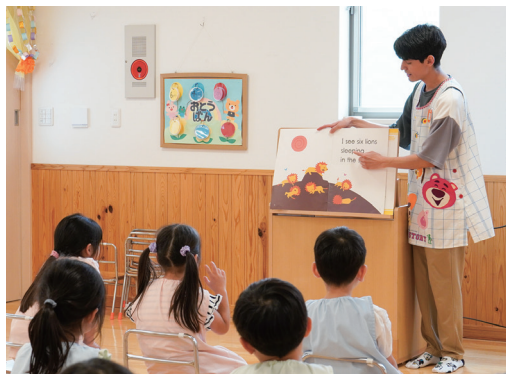
レッスンはイングリッシュネームで呼び合う。普段と異なる呼び名は脳を英語脳に切り替えるスイッチに!

集大成となる年長の発表会ではネイティブさながらの発音を子どもたちが披露。最近では卒園児の保護者から「同級生の外国人の通訳を我が子が買って出たよう」とお礼が園に届いたそうです。「自分のやりたいことを見つけ、思う存分楽しめる人生に向かってほしい。そのためには自分で考える力とそれを伝える力が不可欠」。宇田川園長の思いは、確かな力となって子どもたちの一歩を後押ししているようです。