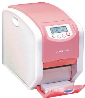
季節に合わせて温度調整可能

入されている自動おしぼり機です。その清潔さの理由はロールタオル。使用前後で洗浄や消毒が必要となる従来の布おしぼりとは異なり、医療現場でも使用される不織布のロールタオルを使用しているため、焼却ゴミとして使い捨てができ安心です。さらにロールタオルには抗菌加工が施されているため、雑菌の増殖を抑え感染防止対策にも効果的です（誤って子どもが口に入