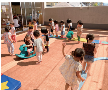
裸足で遊ぶ園児たち