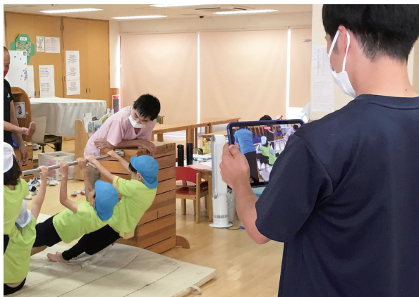
配信するのはクラス担任の先生たち。「楽しく伝えたい」という思いから、お昼寝風景をタイムラプスで撮影したことも！

共に育ち合うことを理念に掲げる原町みゆき保育園は2023年5月に動画配信アプリ「てのりの」を導入。半年間で配信した動画は540件を超えます。高頻度の配信を維持する工夫を伺いました。