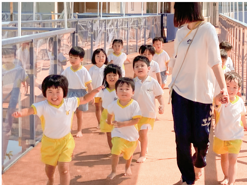
ドリームコークは人や環境にやさしい天然コルクを使用。遮熱・弾力・軽量・遮音・透水など多くの特性を持つ。夏の日射でも高温にならず、安全な場所として活用できる