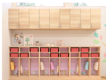
園向けに収納やシューズボックスも販売。背板にイラストを入れられる

製品を展開する中で同社が聞いたのは「園に個性を持たせたい」という声でした。そこで2022年、「セーフケアプラスイラスト付きドア」を