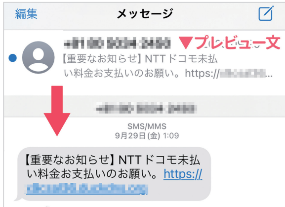
SMS に届くスミッシング詐欺のメッセージ

データのクラウド化も一般的になりました。いつでもどこでも活用できて便利ですが、突然サービスが終了するリスクもあります。信頼できるサービスを利用する、バックアップを取るなど対策を。