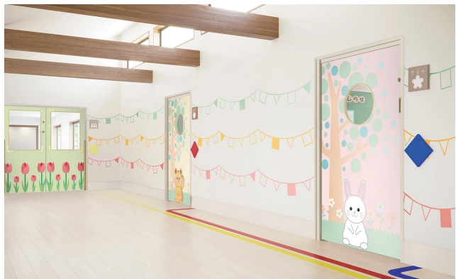
イラスト・ドアデザイン・色柄の組み合わせは6,000パターン以上。園独自の希望デザインがあれば、相談にも応じられるとのこと

選ばれる園づくりの実践例として、理念や想いを体現した個性的な園舎や内装が注目されています。内装建材を提供する永大産業(株)に、安全への配慮や園の声で生まれた商品について伺いました。