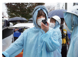
(上)無線機で後方の園長と連絡をとる大代保育園の保育士 (右)歩道橋を避難車を押して渡る参加者

雨天となった訓練当日。シェイクアウト訓練後の二次避難は高台にある小学校までの避難経路の危険性を確認したり、避難車を押す保育者をサポートしたりしながら訓練を行いました。道路状況を確認する先発隊と後発隊との連絡にはサポーターとして訓練に参加する(株)ニシハタシステムがIP無線機を提供。