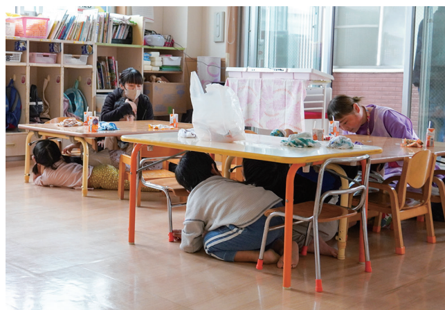
シェイクアウト訓練。サイレンの音を聞き、頭を守る園児たち

東日本大震災で大きな被害を受けた宮城県多賀城市。2023年11月、同市の柏幼稚園・大代保育園で大規模地震を想定とした合同避難訓練・講習会が実施され、市内外から58名が参加しました。