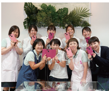
取材に答えてくれた先生たち

保護者からは「保育室や散歩先、食事中どの写真も楽しみ。普段の様子を知ることができてうれしい」「友だちと一緒に写真は特別感がある」と日常写真の販売に喜びの声が届いています。カメラマンによる写真も好評。「運動会でのかけっこなど躍動感あふれる写真はプロならではの。そだちえは価格も良心的」と手頃な価格設定も喜ばれています。